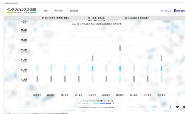
Engineer Chart ~「今」の自分を見つめ直す