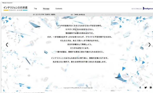
メッセージページ