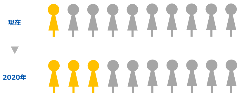
「新卒エージェント」サービス普及率（当社推計）

転職市場では広く受け入れられているエージェントサービスですが、新卒市場での利用者（サービス登録者）は現在、約 10%にとどまります。DODA新卒エージェントでは、学生へのサービス認知向上を行い、2020年には、新卒市場において約 30%の就活生が利用するサービスへの拡大を目指します。