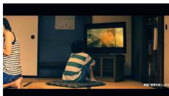
ひとりで TV の「進撃の巨人」映画予告に見入る少年。