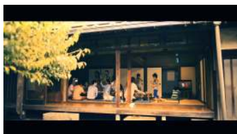
田舎の夏休み。親戚が集まる家。