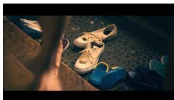
ひととき大きな足が...