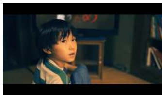
「おじちゃん？」と一言...