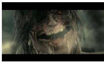
映画の巨人に夢中になっている